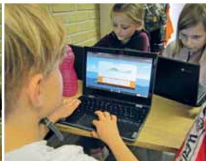
Eleverne i 2.B bruger blandt andet spillet CampMat.