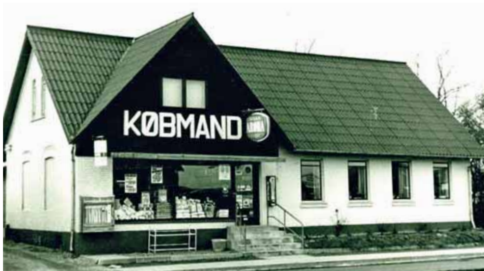
Købmandsforretningen 1967 efter at have fået ny facade og nyt tag. Der er stadig væk bolig til højre.