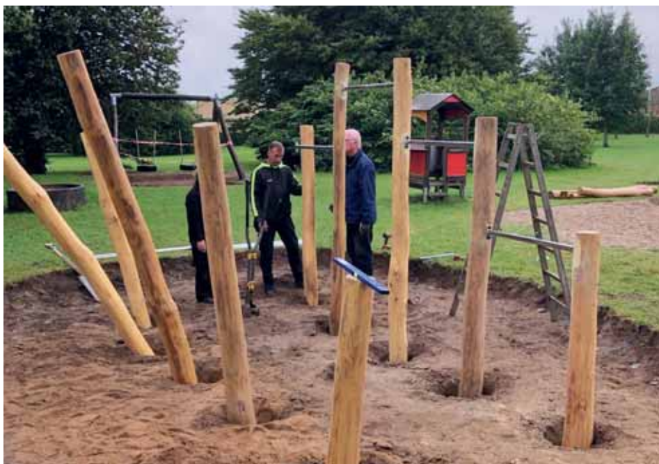
Opsætning af parkourbaneredskaberne er udført i robinie træ og rustfrie stålstænger.