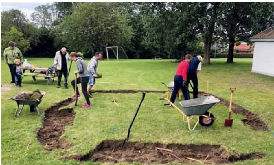
Stor tak til de frivillige hjælpere for det hårde slid med at grave ud til redskaberne.