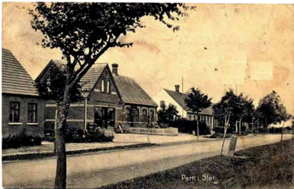
Slet købmandsforretning ca. 1910. Postkort.

Af Lars Kjærsgaard Johansen – Tranbjerg Lokalhistoriske Samling