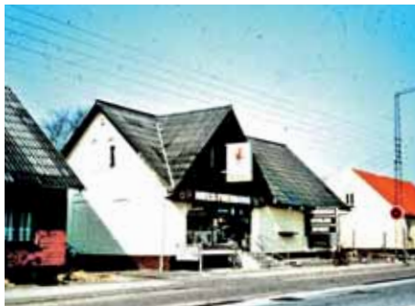
Niels Fredborgs cykelforretning 1980.

Det var den kendte cykelrytter Niels Fredborg, som købte forretningen og ændrede den til en cykelforretning. Niels Fredborg var landskendt, og det blev omtalt i medierne, da han valgte at åbne en cykelhandel