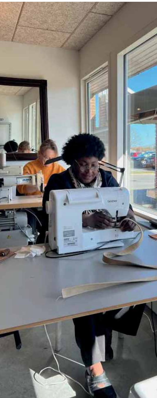
Felicité og Lillia er i gang med dagens produktion ved symaskinerne.

bruges til at skabe jobmuligheder i form af småjobs, fast- eller projektansættelser.