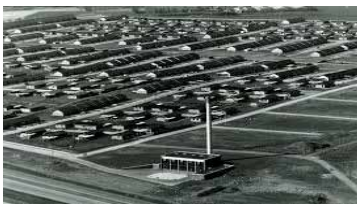
Billede 1: Tranbjerg Varmeværk i 1970'erne