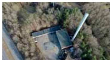
Billede 2: Tranbjerg Varmeværk 2025