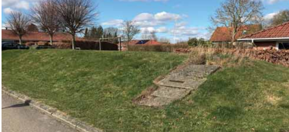
Beskyttelsesrummet på Tranbjerg Tværvej er opført 1944-1945. Det er 18 m langt, og havde plads til ca. 50 personer. Nedgangen ses forrest i billedet.