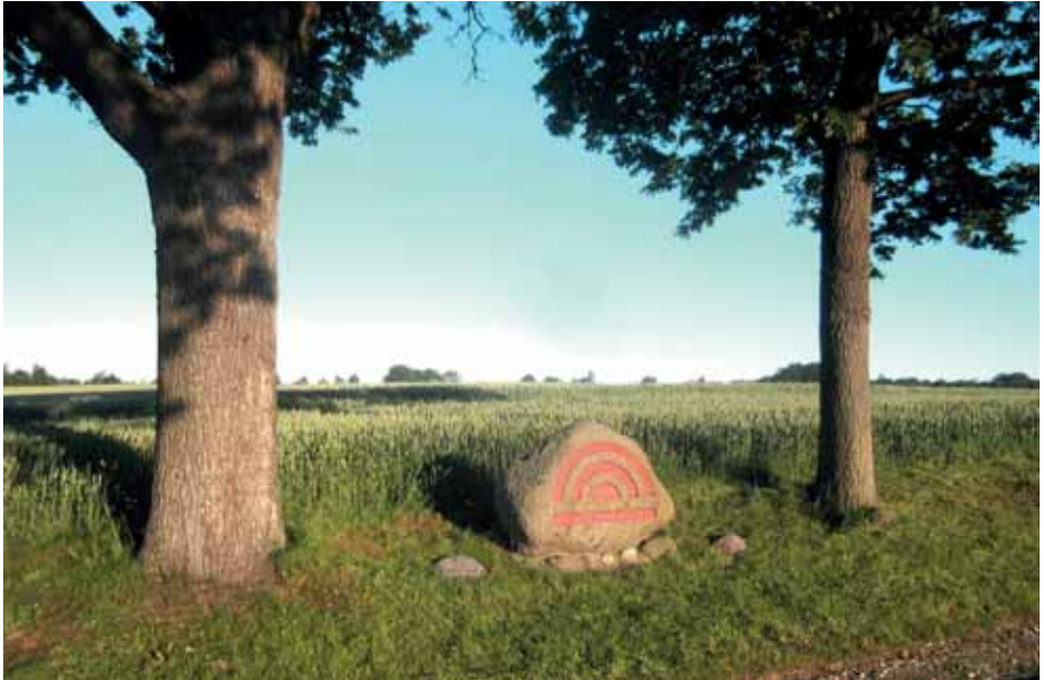
Mindestedet på Ellemosevej med den store og de to små sten mellem de to træer. Fotograferet mod sydvest, juli 2015.