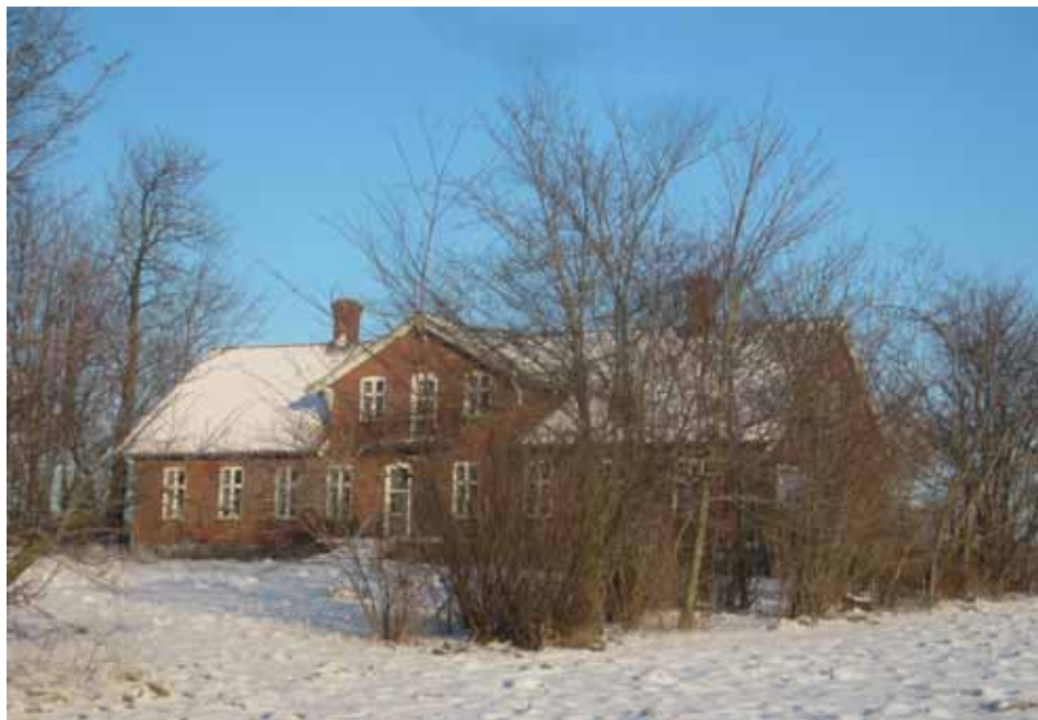
Ovesmindes stuehus fra 1892 fotograferet fra havesiden i januar 2016. Den store kvist er bygget til senere, måske ca. 1930.