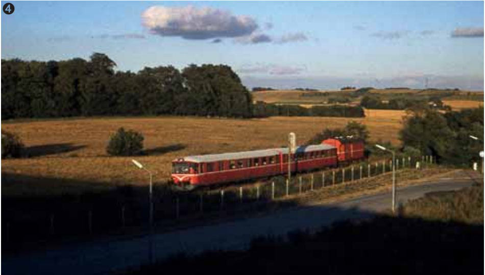
Y-togsæt med posttog D62 den 28-8-78 ved Torvevænget

4. Det er sjældent, man ser fotografier af postvogne på Odderbanen efter 1970, men Jørgen Knudsen har fotograferet postvogn D62 ved svinget i Torvevænget den 28. august 1978. Den er koblet til en Y-vogn med bivogn. Fotografiet må være taget fra broen over Torvevænget, og de lange skygger tyder på, at det er sidst på dagen. Ifølge oplysningerne på HHJs togliste er D62 bygget i 1938, og i 1971 købte HHJ det af DSB. Det blev udrangeret i 1982.