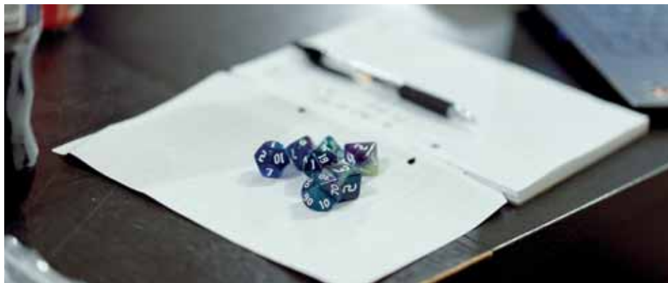
Terninger er en vital del af spillet.

Har du lyst til at være med i fællesskabet, er du velkommen. Du finder mere info i Facebookgruppen 'Tranbjerg DnD'. Der er også en hjemmeside på trapperne.