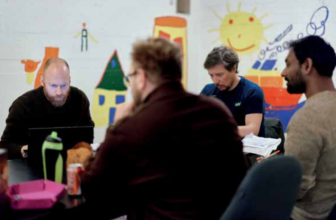
Der lyttes intenst til aftenens historie.