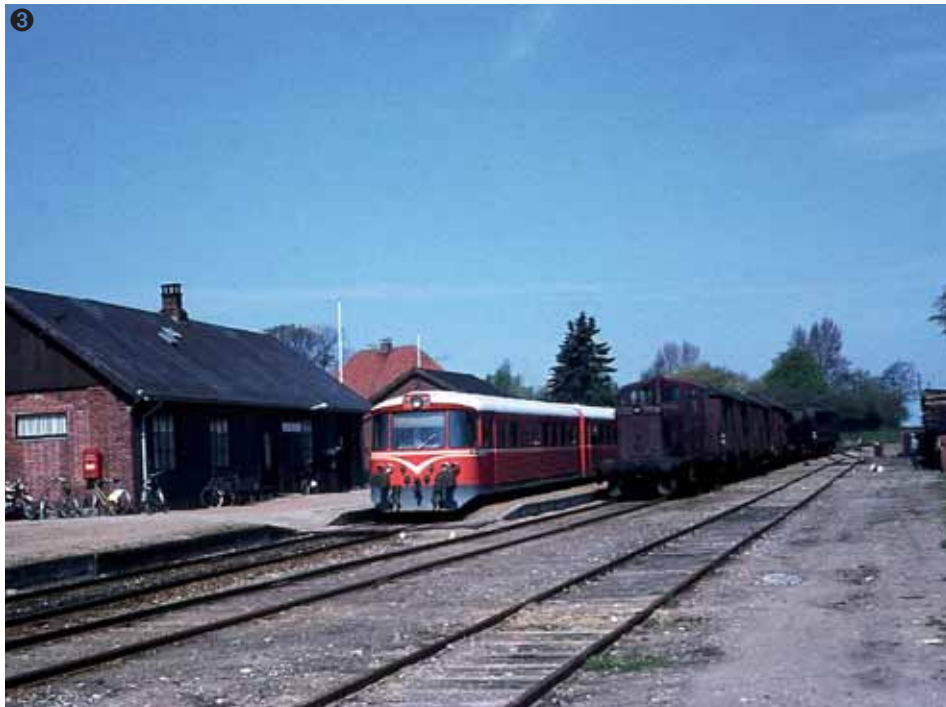
DL 12 krydser Ys 45 og Ym 34 i Tranbjerg 17-5-1977

3. Fotografiet er taget på Tranbjerg Station den 17. maj 1977, og ifølge billedteksten krydser godslokomotivet DL12 Y-toget Ym34 og Ys45. De fleste husker stadigvæk Y-togene, og de er først og fremmest de tog, man i dag forbinder med det folkelige navn ”Oddergrisen”. De blev anskaffet af HHJ mellem 1968 og 1984, og de blev først udrangeret i 2012, da de i forbindelse med etableringen af Nærbanen blev erstattet af Desiro togene. Y-togene blev også kaldt for Lynette-tog, som var en henvisning til DSBs lyntog.