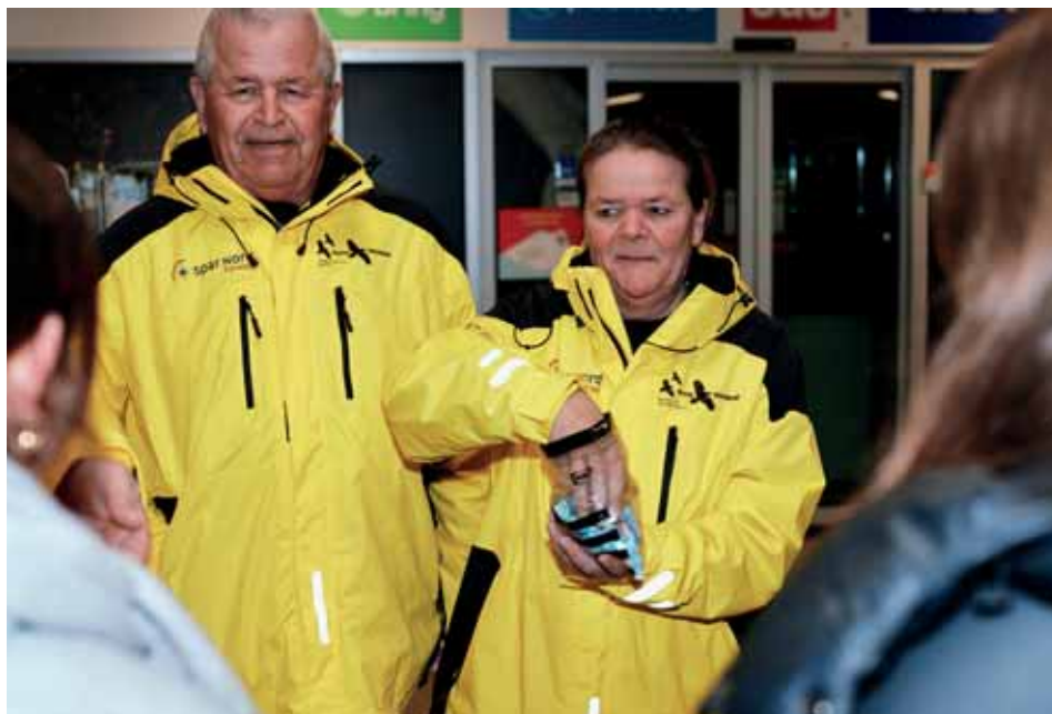
Når Natteravnene møder unge, er det i øjenhøjde og uden at løfte pegefingre. De tilbyder bolsjer, en snak og tryghed.