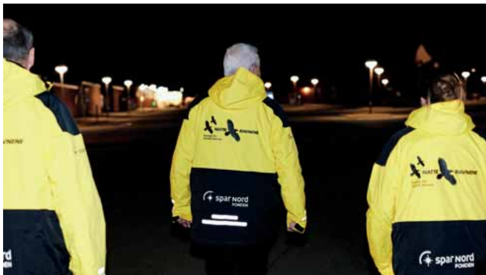
Natteravnene i Tranbjerg er en forening, der hører under Fonden for Socialt Ansvar.