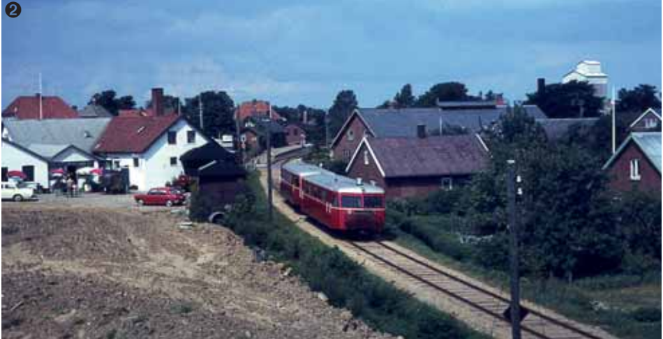
Skinnebus Sm 22 og Sp 1 forlader Tranbjerg mod syd den 22-7-1967

2. På billedet fra den 22. juli 1967 ses en skinnebus, der netop har forladt Tranbjerg station på vej mod Gunnestrup og Mårslet. Billedteksten oplyser, at skinnebusserne er motorvogn Sm22 og bivogn Sp1.